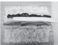
シャリは150g~160gぐらいの少な目で。バラ数の子を入れることで歯ごたえにアクセントが。