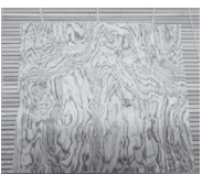
おぼろ昆布は筋と包丁が平行になるよう巻きます。