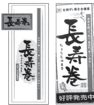
封筒(シール付き) のぼり旗

敬老の日に合わせて、福井県鮭組合が考案したイベント寿司です。愛知県では、この福井の成功を受け、2月3日の『丸かぶりすし』のように、人気商品となるよう販売宣伝活動をするものです。