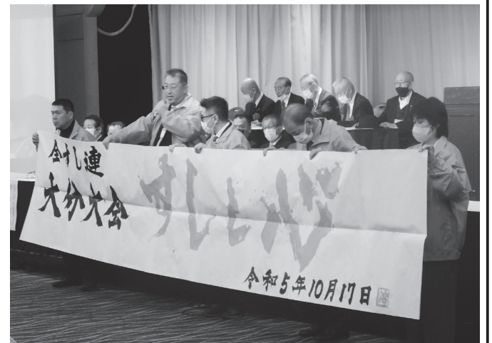
次回開催地大分県の組合員の皆さん