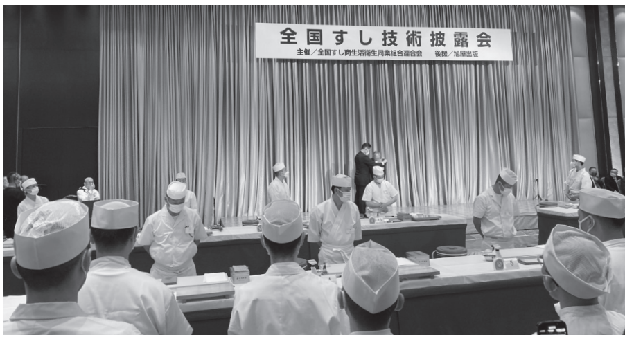
競技前の選手の皆さん