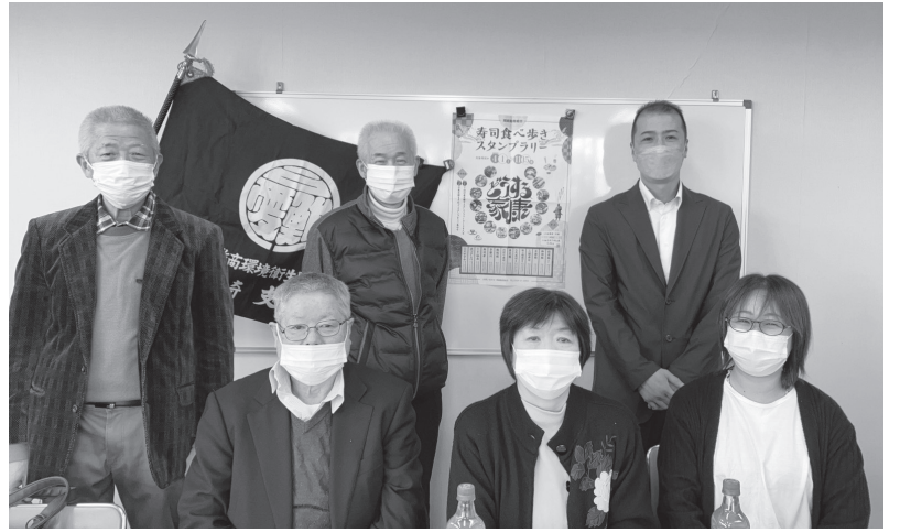
岡崎支部総会での記念撮影

岡崎が大河ドラマ、 “どうする家康”放映や東海オンエアの人気で盛り上がり、我が組合もそれにあやかろうと冊子を作ったり、スタンプリヤーを企画して波に乗っている。