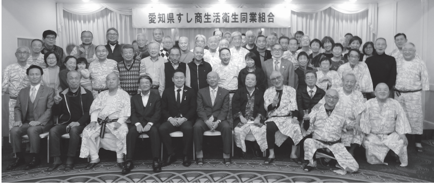
新春懇親会参加者記念撮影