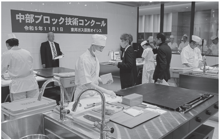
技術コンクールの様子